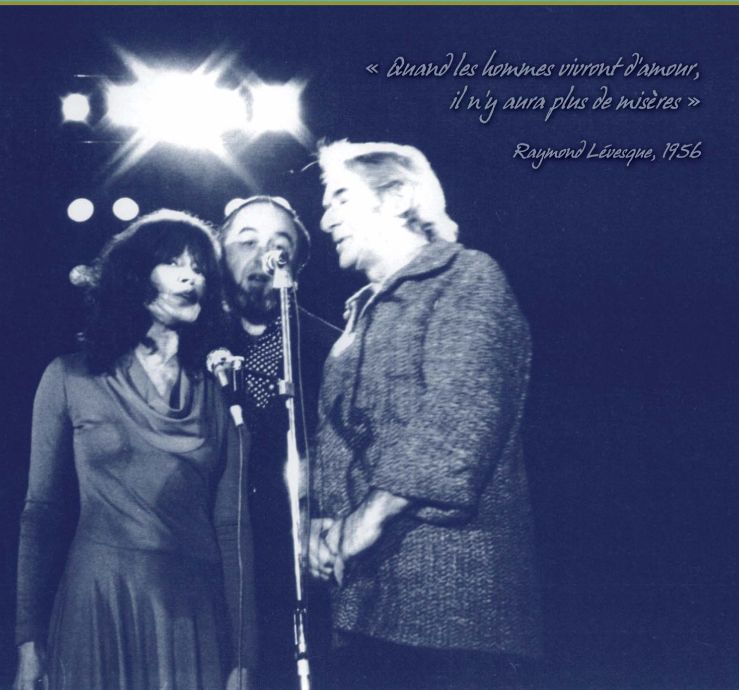
Pauline Julien, Raymond Lévesque en compagnie de Félix