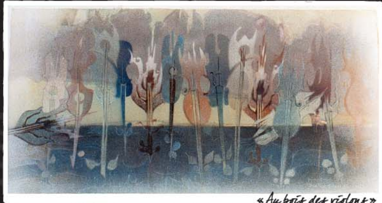
« Au bruit des violons »